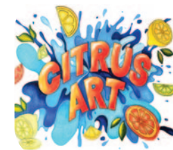
Illustrazione di Alyssa Braz (11 classifiche 2023)

I visitatori saranno invitati ad esprimere la propria preferenza, che darà luogo ad un premio di "giuria popolare", oltre a quelli stabiliti dalla giuria di esperti.