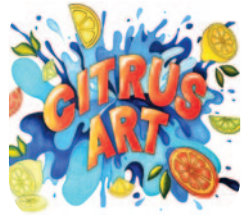
Illustrazione di Alysia Brizio (il classificato 2025)

I visitatori saranno invitati ad esprimere la propria preferenza, che darà luogo ad un premio di “giuria popolare”, oltre a quelli stabiliti dalla giuria di esperti.